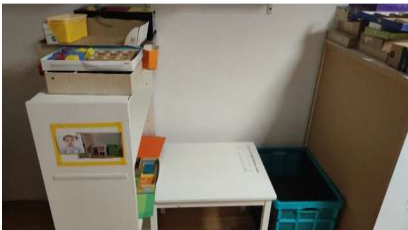
Slika 9: Kotiček za individualno delo.

Prisotne smo bile tudi pri snoezelen terapiji v drugi skupini, ki je potekala v za to namenjeni senzorni sobi. Dejavnost je otrokom omogočila, da so se med posameznimi aktivnostmi nekoliko sprostiti in umirili.