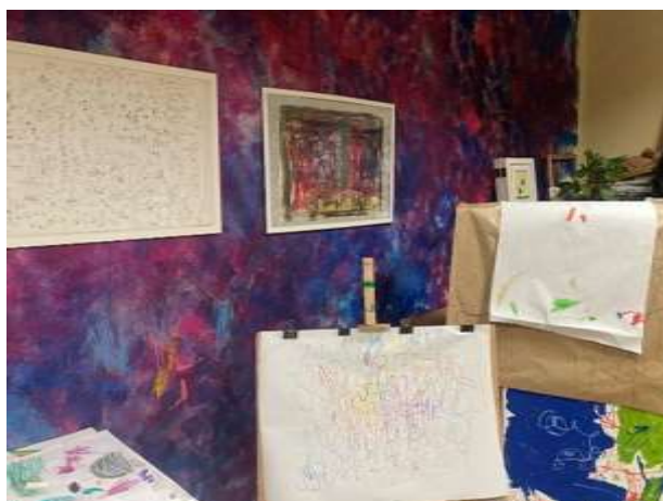
Slika 2: Soba za »art« terapijo.

Prvi dan nam je bila predstavljena tudi dnevna rutina otrok v centru. Po prihodu otrok v vrtec oziroma šolo sledi vsakodnevna jutranja dejavnost, pri kateri si vsak otrok izbere svoj »pozdrav« (na kakšen način bo pozdravil svojo vzgojiteljico). To lahko naredijo tako, da jo objamejo, ji pomahajo, dajo »kepec« ali se z njo rokujejo. To storijo tako, da pokažejo na slikovni pripomoček, ki visi na vratih. Vsak otrok si nato ogleda svoj slikovni urnik in s pomočjo sličic sledi poteku dneva. Urnik je lahko predstavljen s fotografijami, simboli ali z besedami – odvisno od otrokovih sposobnosti in potreb.