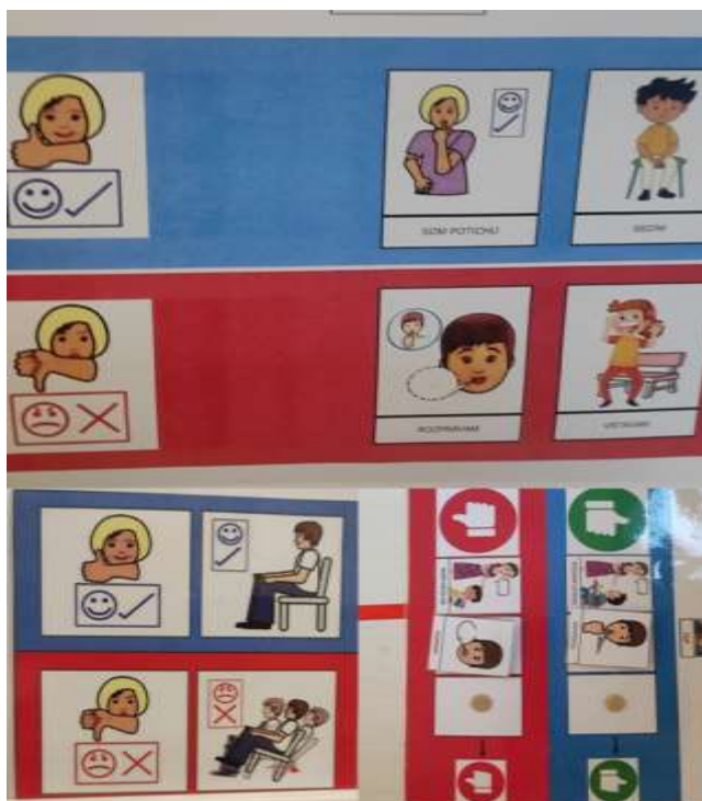
Slika 6: Pravila obnašanja.

Po predstavitvi poteka dela v instituciji, smo preostanek dneva opazovale različne strokovne delavke pri njihovem delu z otroki. Sprva smo bile prisotne pri jutranjih aktivnostih na preprogi z višje funkcionalnimi otroki.