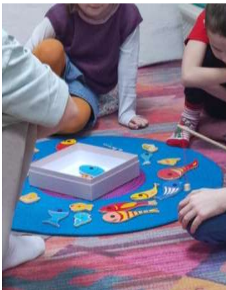
Slika 7: Jutranje aktivnost na preprogi.

Kasneje smo opazovale razvijanje socialnih veščin pri šolskih otrocih. V nadaljevanju pa še skupinsko delo z otroki z nižjimi sposobnostmi, ki nam je bilo najbolj zanimivo, saj so bili v skupini otroci, ki funkcionirajo na podoben način, kot otroci s katerimi vsakodnevno delamo tudi mi. Pri opazovanju dela smo na ta način dobili veliko idej za pedagoško delo pri nas. Po vsaki končani dejavnosti ali delu dejavnosti, otrokom s pomočjo sličice sporočijo, da je dejavnosti »konec.« Za vsako pravilno izpeljano dejavnost, otroke tudi pohvalijo.