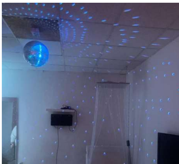
Slika 10: Snoezelen soba.

Drugi dan smo imele priložnost prisostvovati pri uri biologije v šolski skupini. Ker so otroci v določeni skupini različno stari in delajo različne razrede, je tudi delo v šoli zelo individualno usmerjeno. Del pouka se strokovna delavka bolj posveča enim otrokom in drugi delajo individualno, potem pa se zamenjajo. Prisotne smo bile še pri dejavnostih v telovadnici za predšolske otroke z višjimi sposobnostmi. Tudi dejavnosti v telovadnici so strukturirane in sledijo točno določenemu urniku. Tako kot prvi dan je za zaključek sledil še pogovor o vtisih in načrtovanje prihodnjega dne.