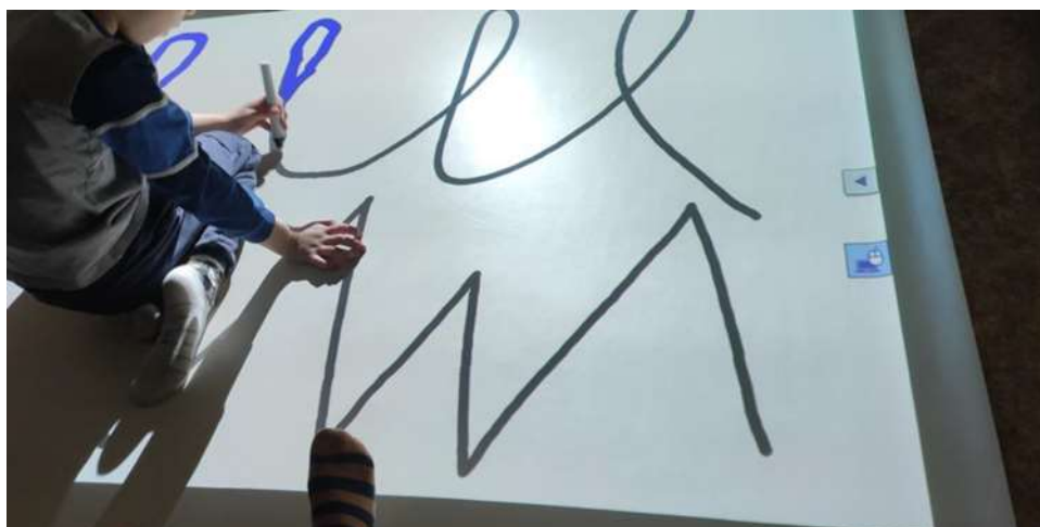
Slika 12: Delo na interaktivni tabli.

Zadnji dan senčenja smo zaključile s prijetno in sproščeno evalvacijo, na kateri so bile prisotne direktorica centra, naša mentorica in likovna terapevtka. Strokovne delavke so nam bile na voljo za dodatna vprašanja, skupaj pa smo naredile tudi kratko primerjavo med šolskim sistemom v Sloveniji in na Slovaškem. S senčenjem smo bile vse zelo zadovoljne. Vse smo soglasno poudarile, da je bila predstavitev izjemno poučna, izvedena na visokem strokovnem nivoju, in hkrati dokaz, da z vztrajnim timskim delom vseh vpletenih (vključno s starši in otroki), lahko nekatere otroke z motnjo avtističnega spektra uspešno pripravimo na vključevanje v širše življenjsko okolje, občolske aktivnosti ter redno šolo.