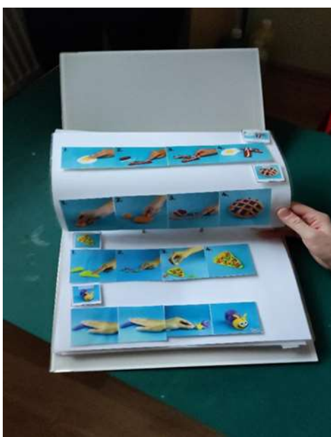
Slika 8: Načrt modeliranja po sličicah.

Prvi dan smo opazovale še skupinsko delo za mizo, ki je obsegalo modeliranje z namenom razvijanja fine motorike. Tovrstno delo je načrtovano na način, da s pomočjo slikovnega gradiva otroci vnaprej vedo, kaj bodo ustvarjali.